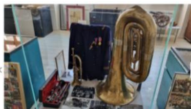
12 / 12 Le centre de l'espace culturel Gérard Hertzog est réservé aux expositions temporaires, avec en ce moment une vitrine consacrée aux 130 ans de la société de musique Sainte-Cécile.