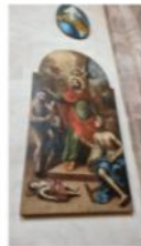
Ces deux tableaux du XVIII e siècle, Le miracle de Saint-Pantaléon et, au-dessus en médaillon, Dieu le Père , viennent d'être restaurés. Saint-Pantaléon a notamment retrouvé son visage d'origine, très inspiré, qui avait été recouvert par un repeint au XIX e siècle.