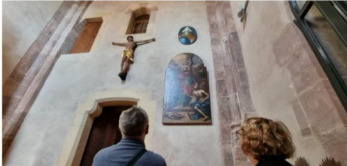
La salle voûtée du clocher roman de l'église Saint-Pantaléon accueille plusieurs œuvres fraîchement restaurées et accrochées.