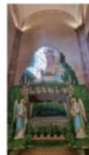
Le Saint Sepulchre ou autel de Pèques, exécuté par Carl Kraft en 1888. C'est le plus complet des cinq existants en Alsace et il est désormais bien entouré.